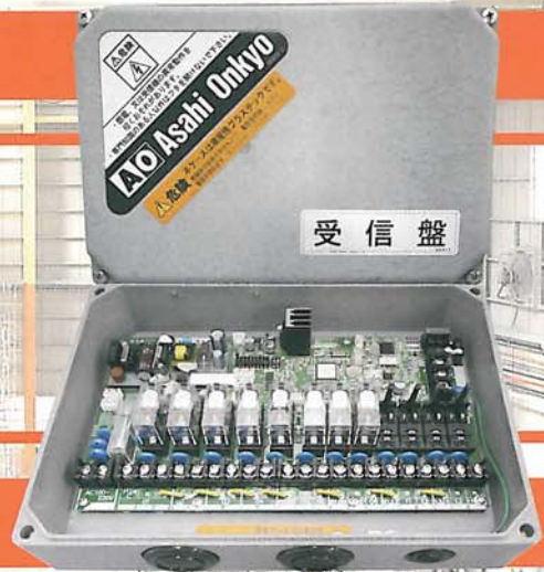
▲ RL-3300型 受信機