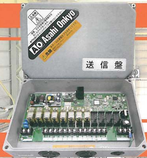
▲ TL-1100型 送信機